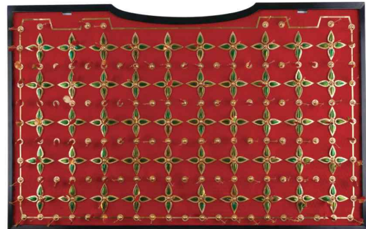
<쪽샘 44호분 비단벌레 장식 말다래 재현품>