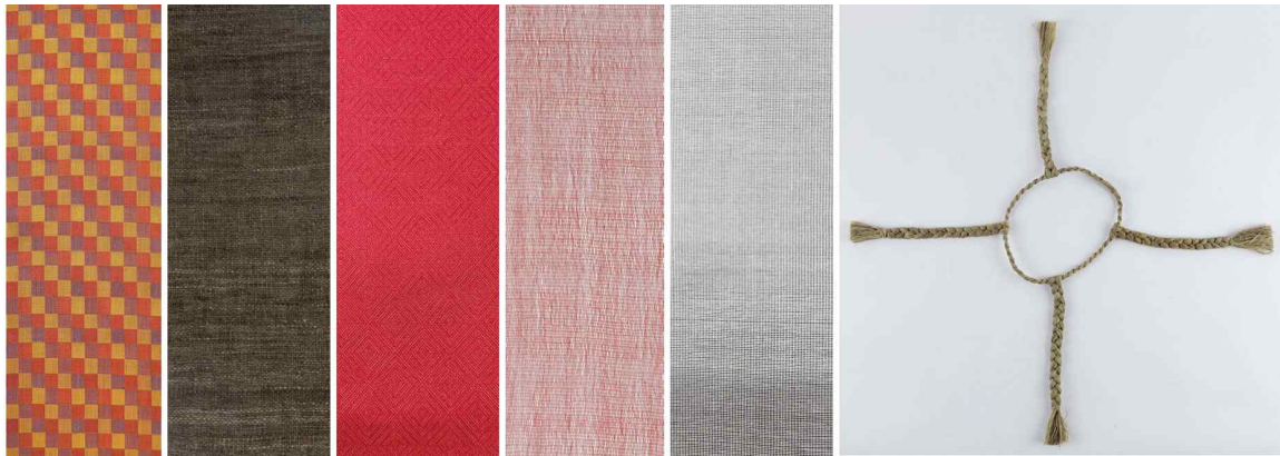
<쪽샘 44호분 직물끈목 재현품>