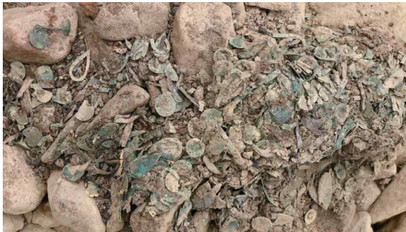
<쪽샘 44호분 비단벌레 장식 말다래 출토모습>