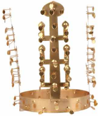
<쪽샘 44호분 금동관 재현품>