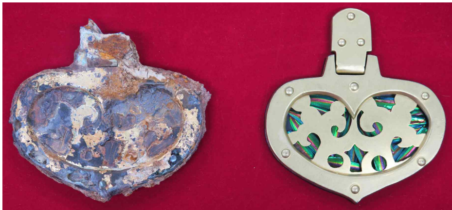
<일본 후나바루고분 출토 비단벌레 장식 말띠드리개(좌)와 재현품(우)>