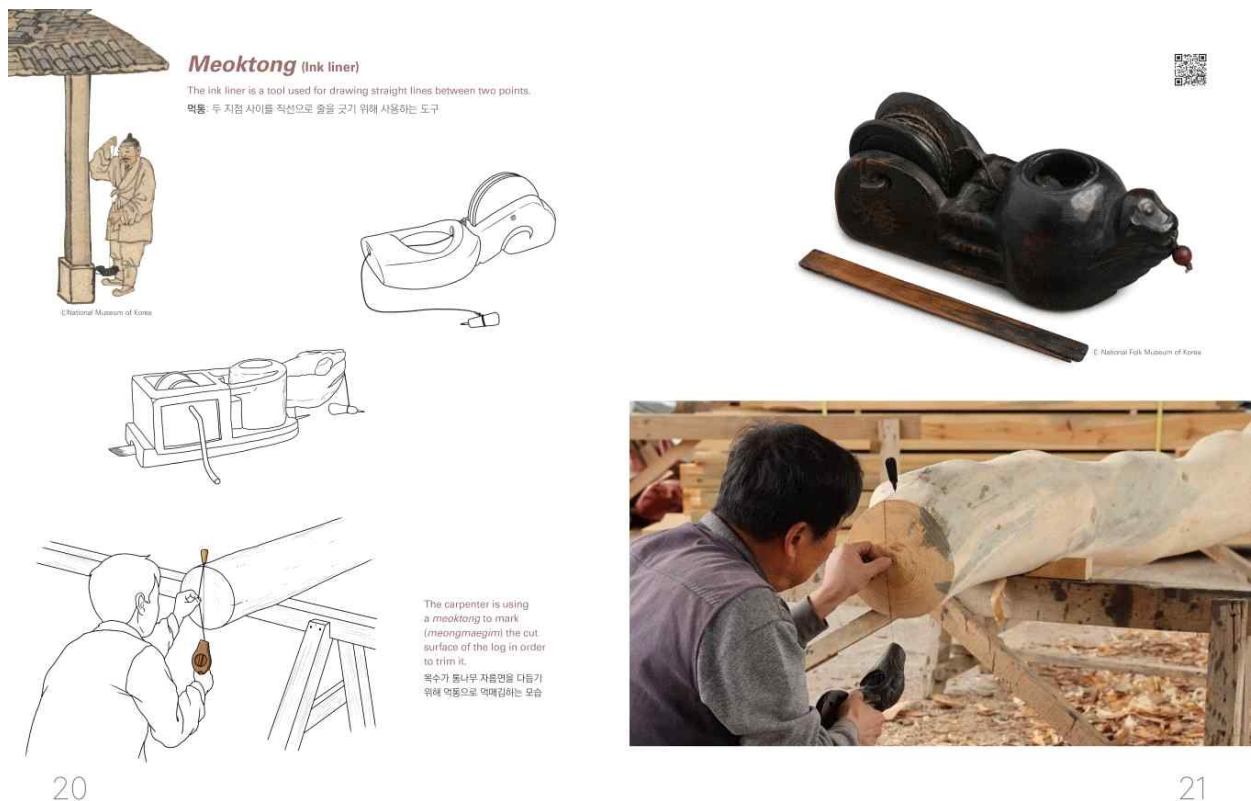
< 영문 도서 내지 중 전통건축 도구 '먹통' 소개 부분 >