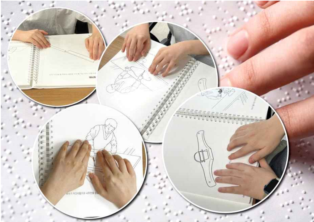
< 시각장애인이 점자촉각도서를 읽는 모습 >