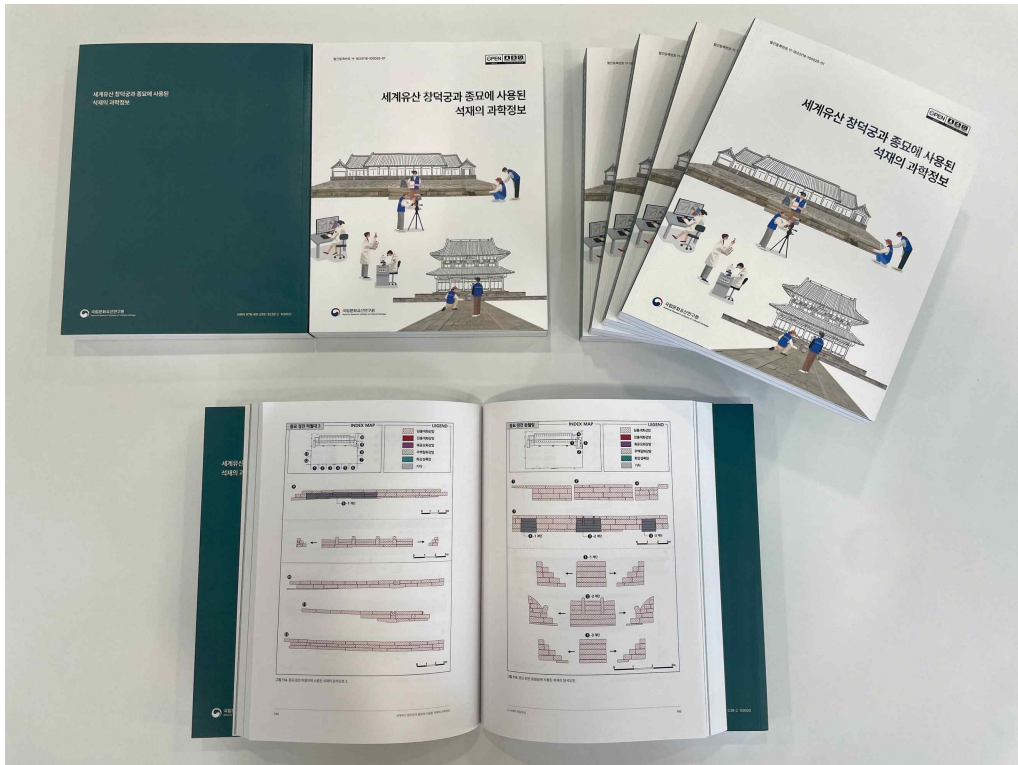
< 『세계유산 창덕궁과 종묘에 사용된 석재의 과학정보』 보고서 >