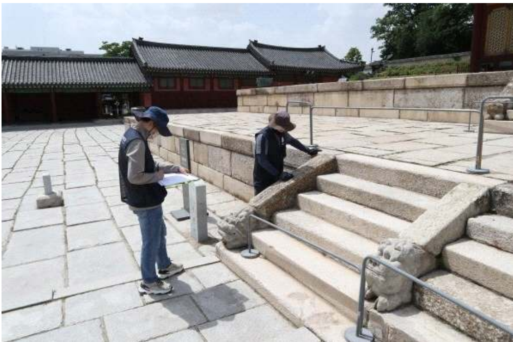
< 창덕궁 인정전 석재 조사 >