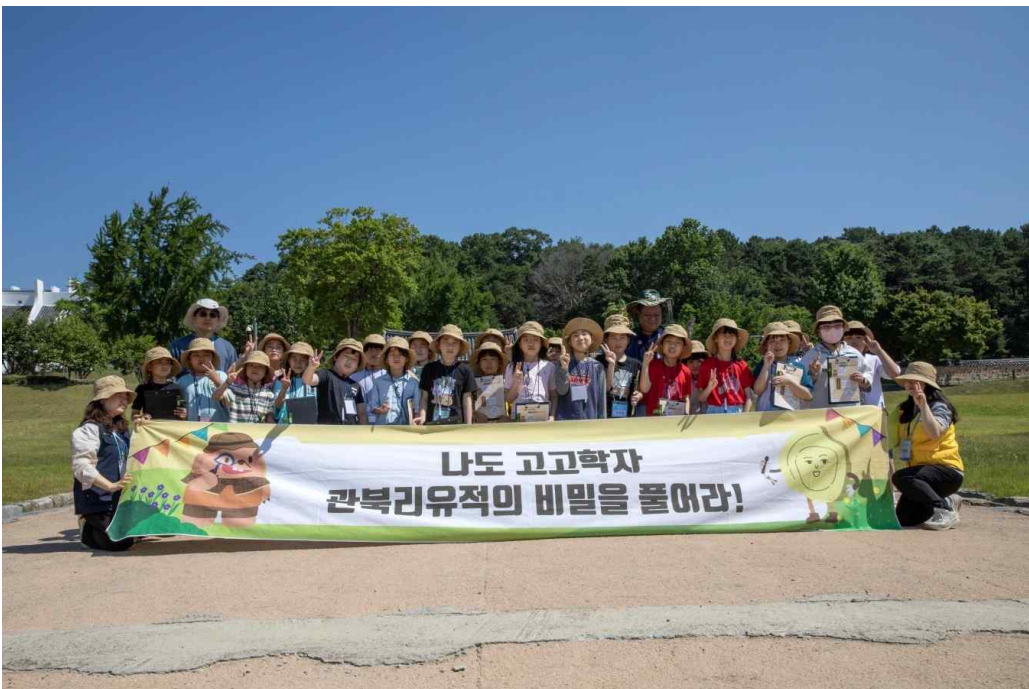
<나도 고고학자 현장학습 - 유적 답사 ('25.6.11.)>