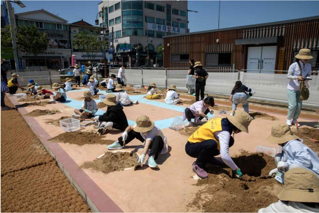
<나도 고고학자 현장학습 - 발굴 체험 ('25.6.4.)>