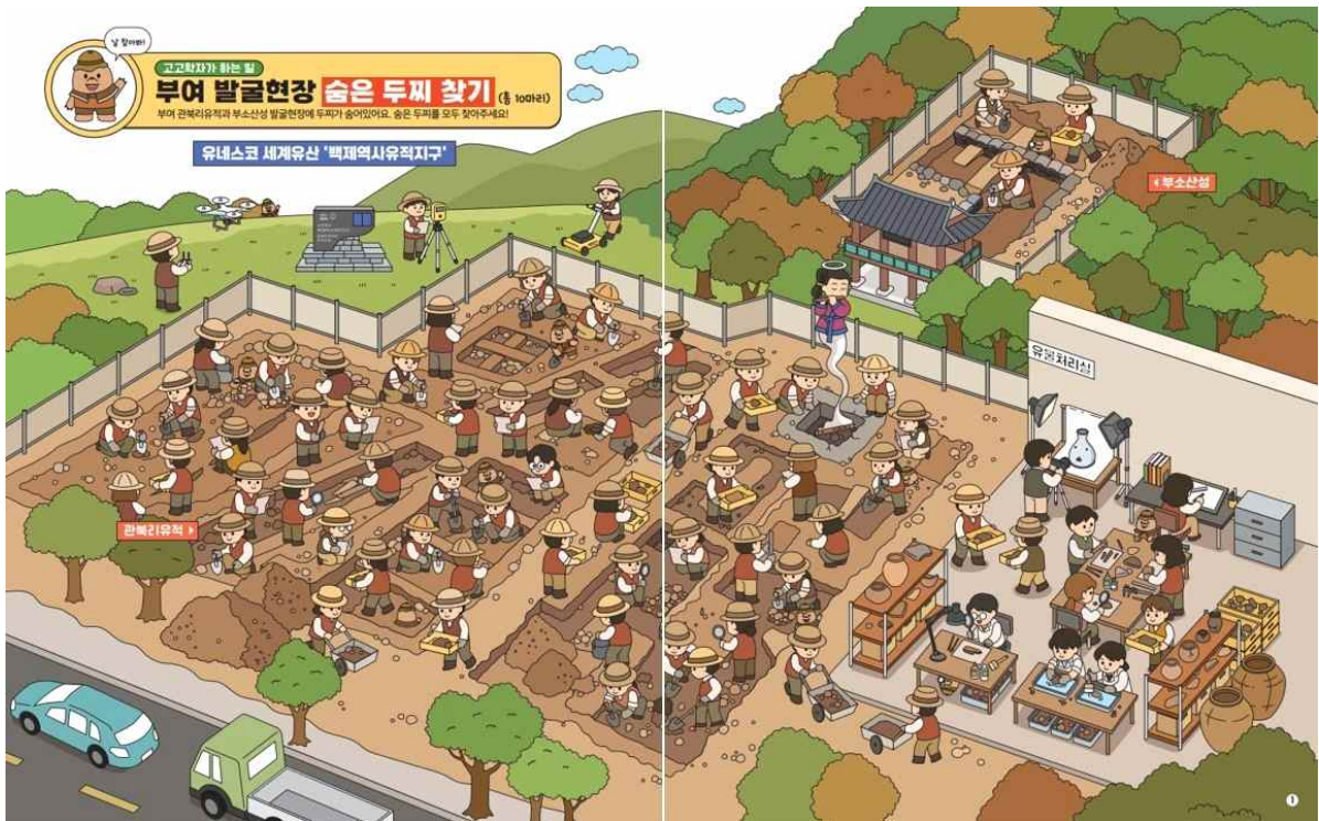
<사전교육 학습지 내지-발굴현장 엿보기->