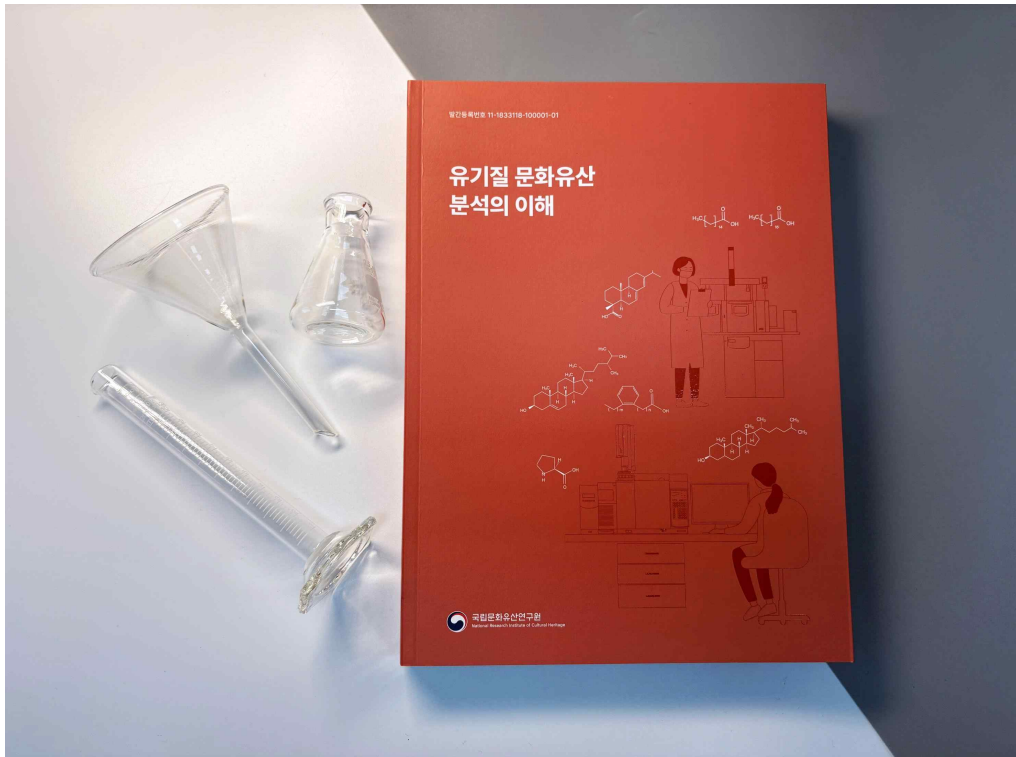
< 유기질 문화유산 분석의 이해 >