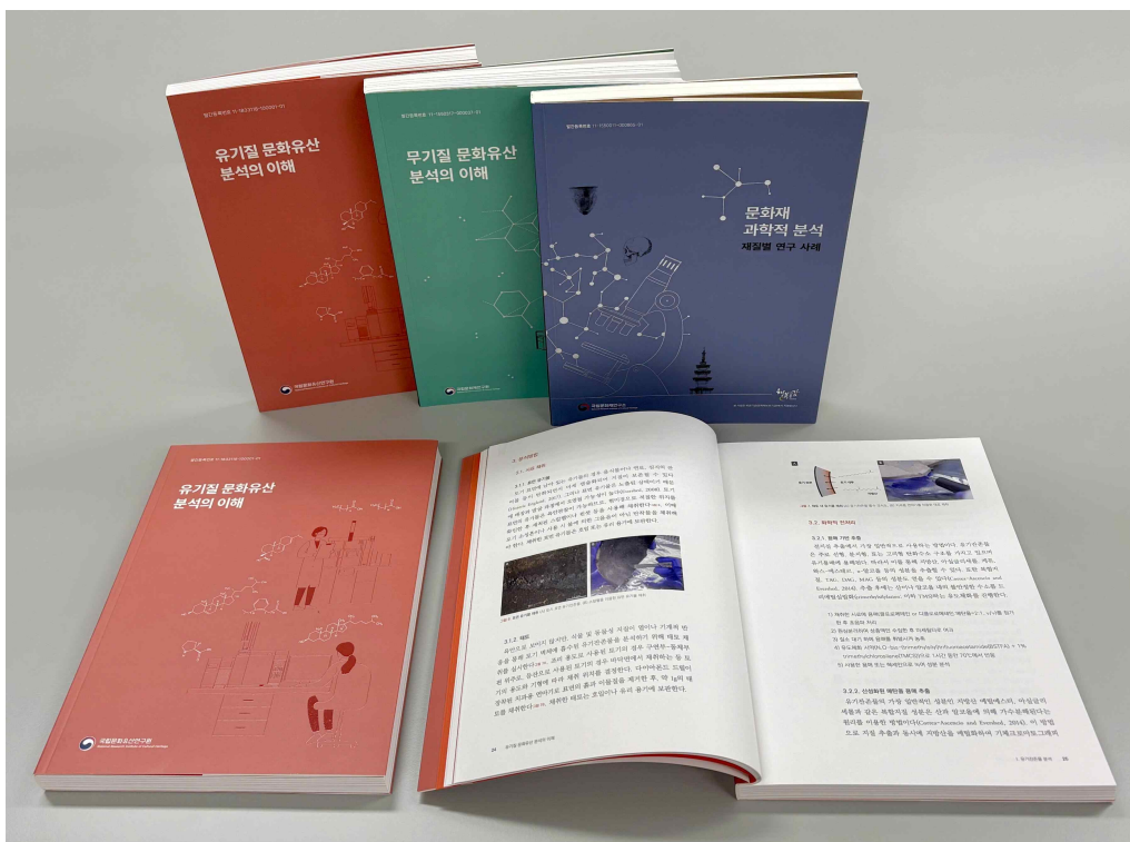
< 문화유산 과학적 분석 연구 성과 및 사례 모음 도서 3종 >