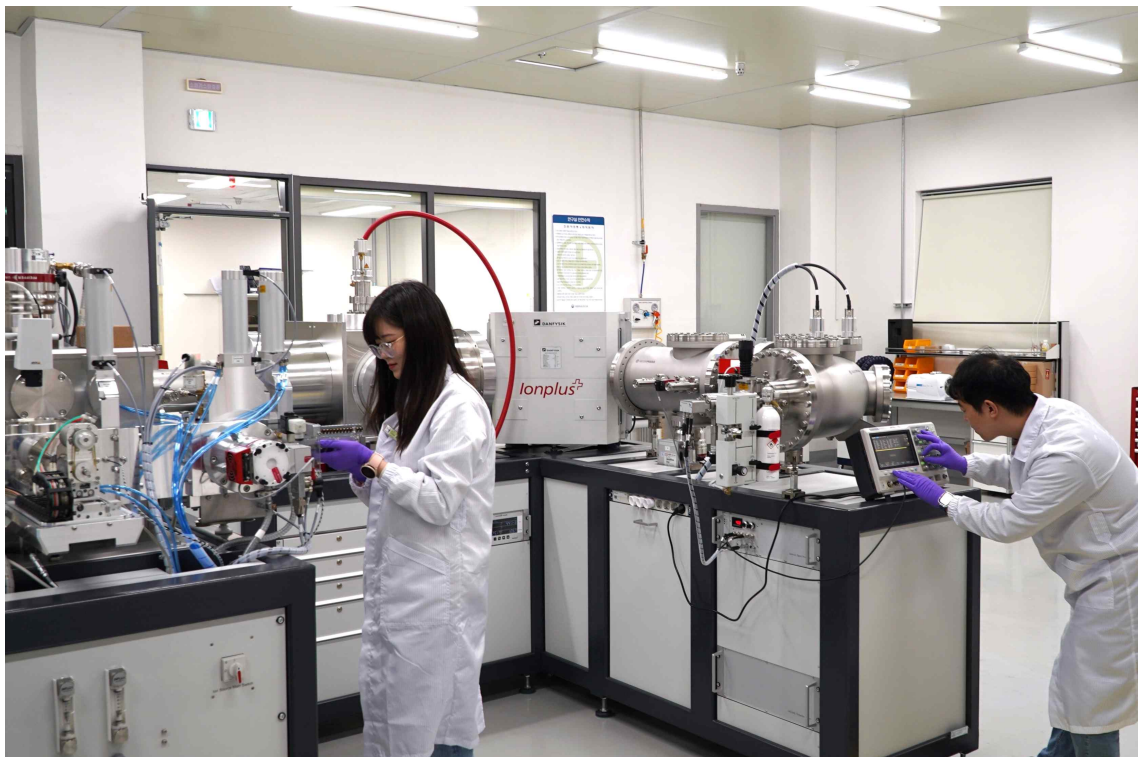
< 가속질량분석기를 활용한 방사성탄소연대측정(AMS연대측정실) >