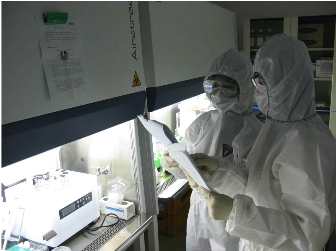
< 옛사람 뼈 DNA 분석 >