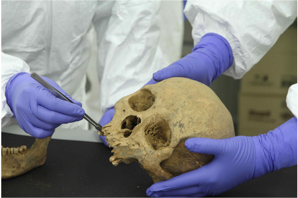
< 옛사람 뼈 DNA 분석을 위한 사전조사 >