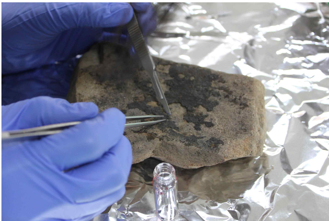
< 토기 내 유기잔존물 시료 채취 >