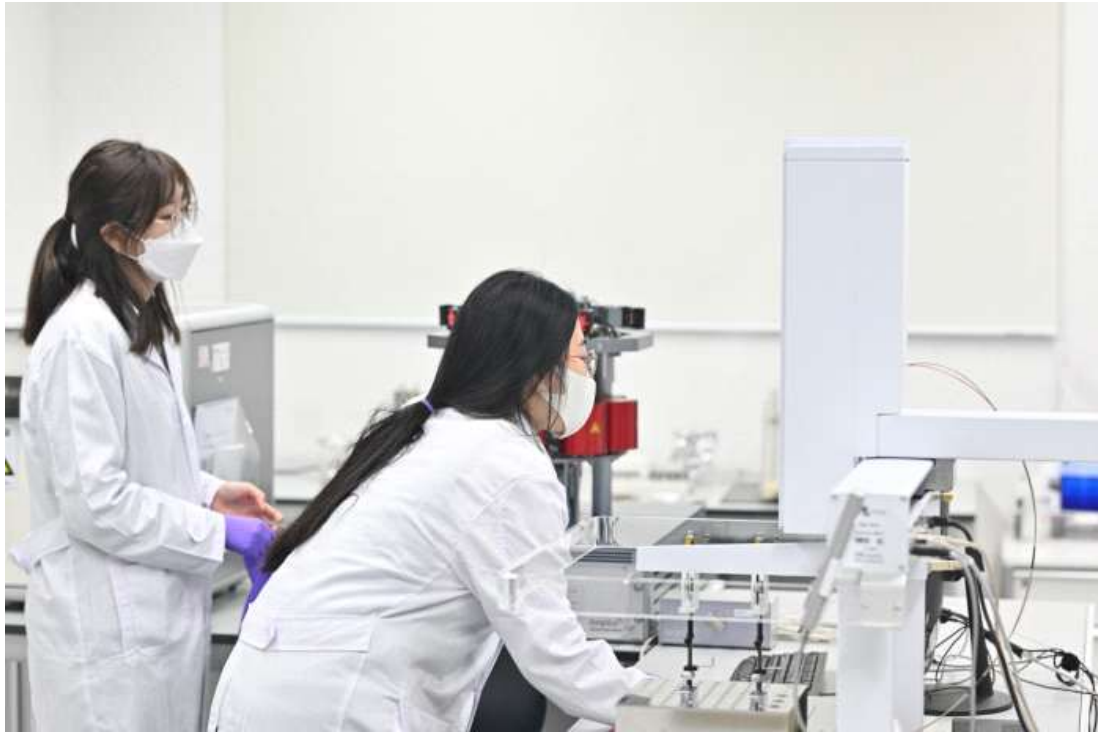
< 방사성탄소연대측정 시료 전처리(흑연화) 과정 >