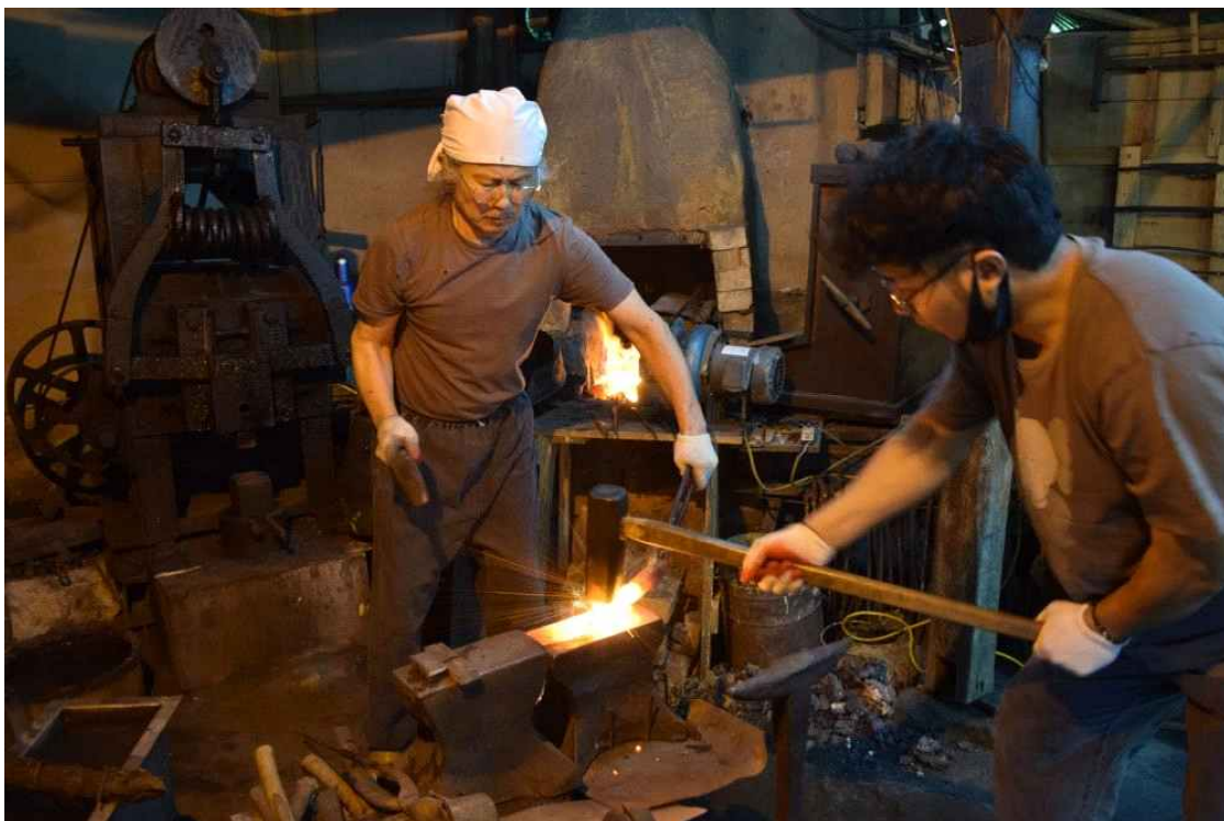
< 단야 실험 현장( '22.6.) >