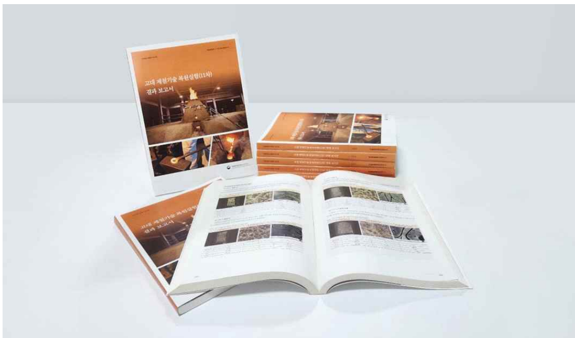
< 『고대 제철기술 복원실험 (11차) 결과 보고서』 >