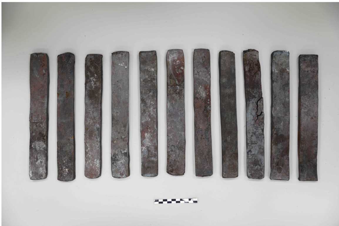
< 제련 실험을 통해 제작된 철로 만든 덩이쇠(鐵鋌, 철정) 모형 >