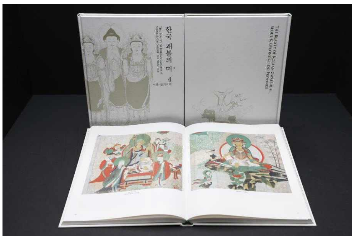
< 『한국 괘불의 미 4: 서울·경기지역』 >