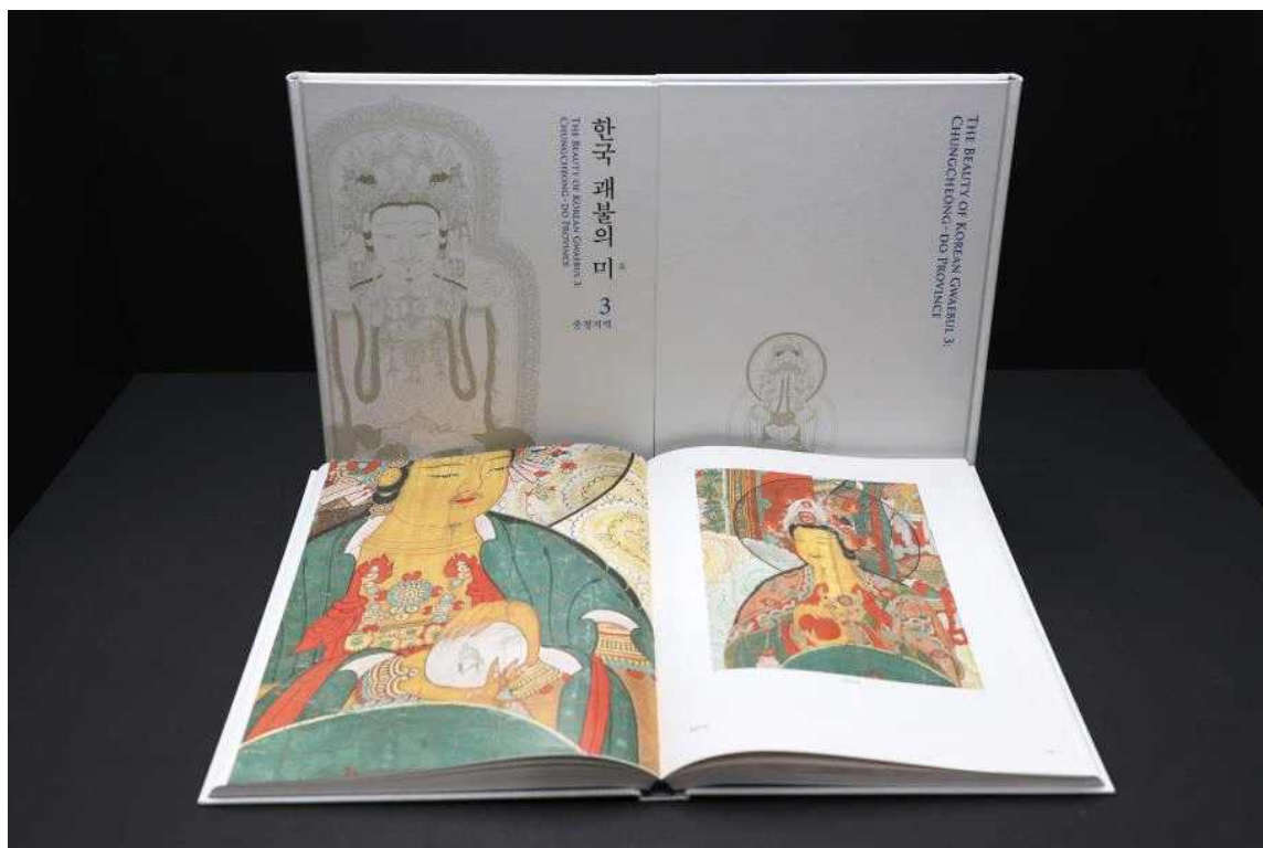
< 『한국 괘불의 미 3: 충청지역』 >