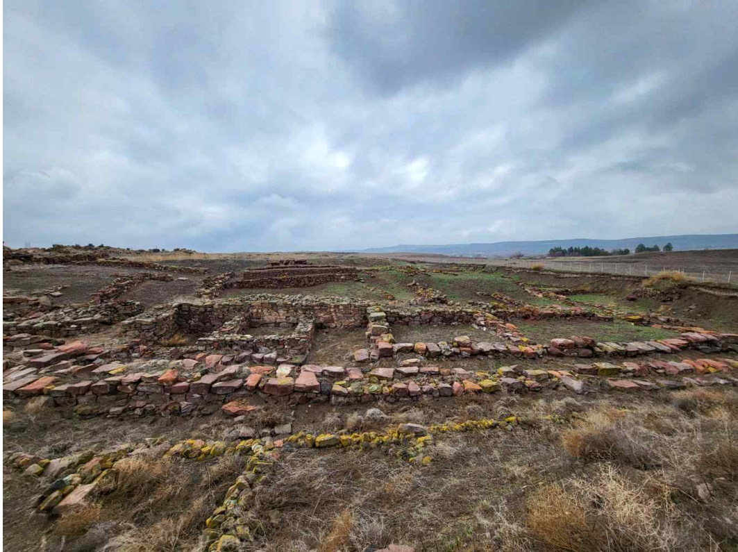
< 쿨테페-카네시 유적 >