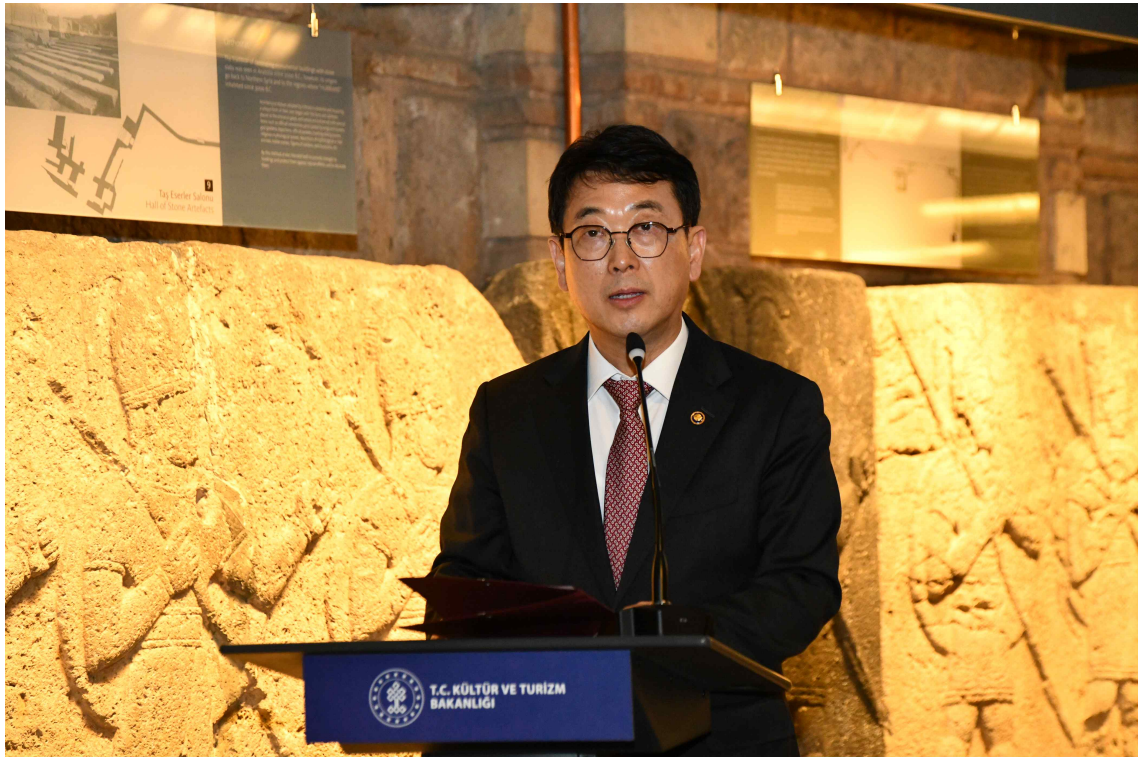
< 한국-튀르키예 문화유산 분야 양해각서(MOU) 체결식에서 인사말하는 최응천 문화재청장 >