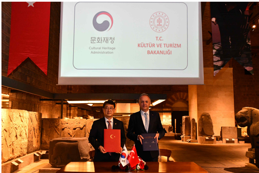
< 양해각서(MOU) 체결 후 기념촬영하는 최웅천 문화재청장(왼쪽)과 괴칸 야즈지 튀르키예 문화관광부 차관 >