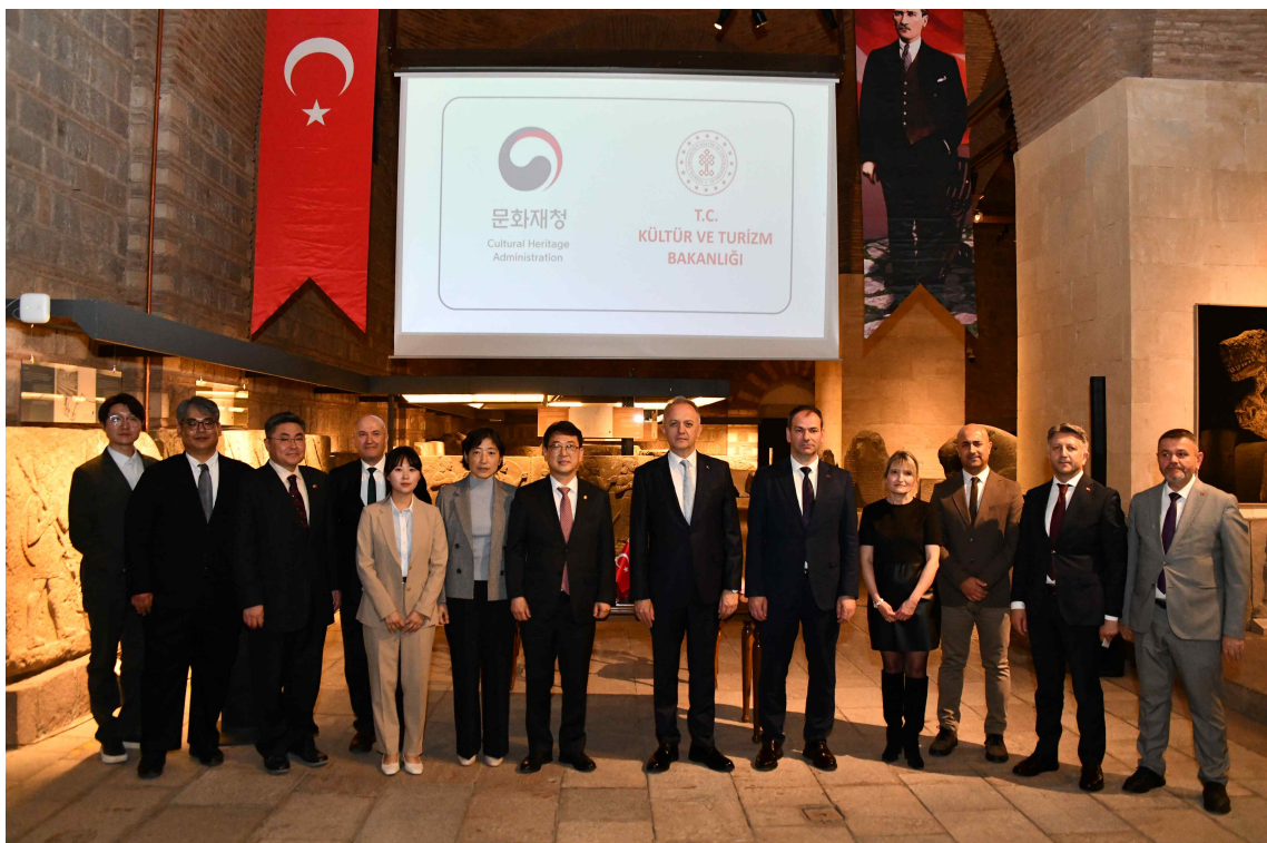
< 양해각서(MOU) 체결 후 기념촬영하는 한국-튀르키예 관계자들 >