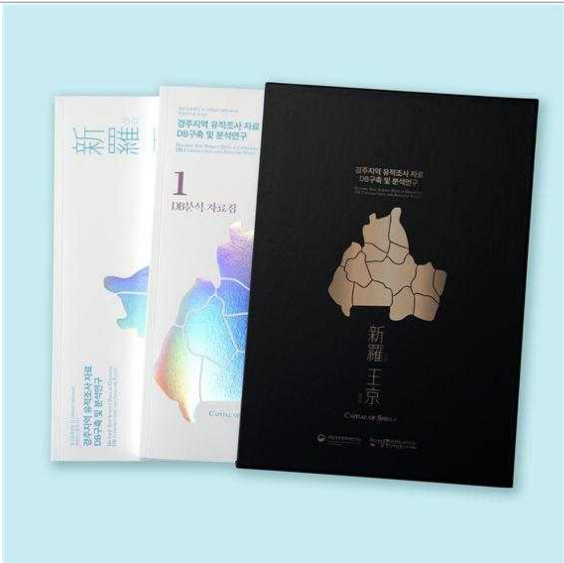
< 『경주지역 유적조사 자료 DB 구축 및 분석연구』 자료집 >