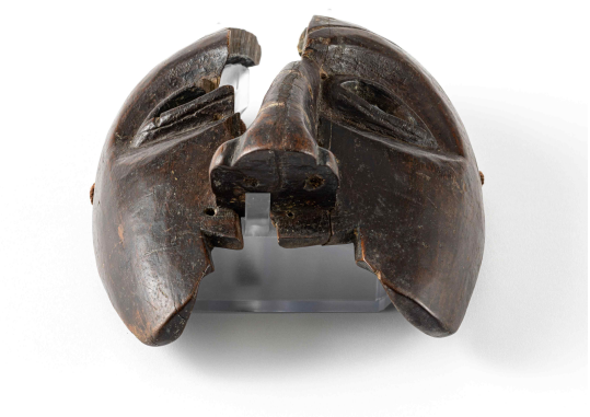
<3차원 출력(3D 프린팅) 기술을 활용한 맞춤형 받침대_병산(을)>