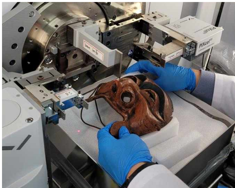
<X선 회절법(XRD) 안료 분석 과정_양반>