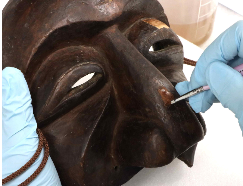
<충진부 색맞춤 작업_병산(갑)>