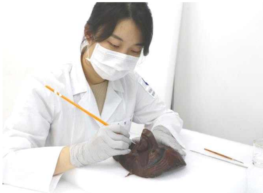
<표면 안료 안정화 작업_선비>