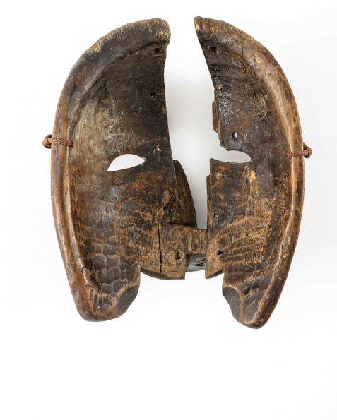
<처리 전·후 사진(후면) _병산(을)_ 좌: 보존처리 전 과거보수 부분/ 우: 과거보수 부분 제거 후>