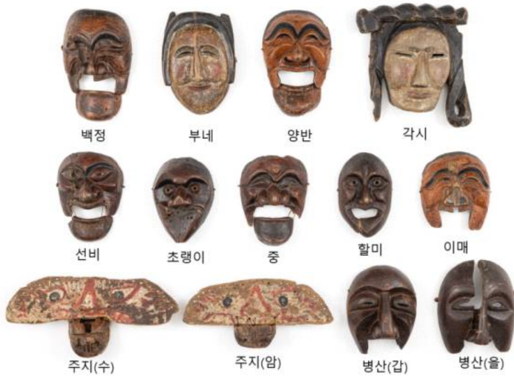
<하회탈 및 병산탈 전체 사진>