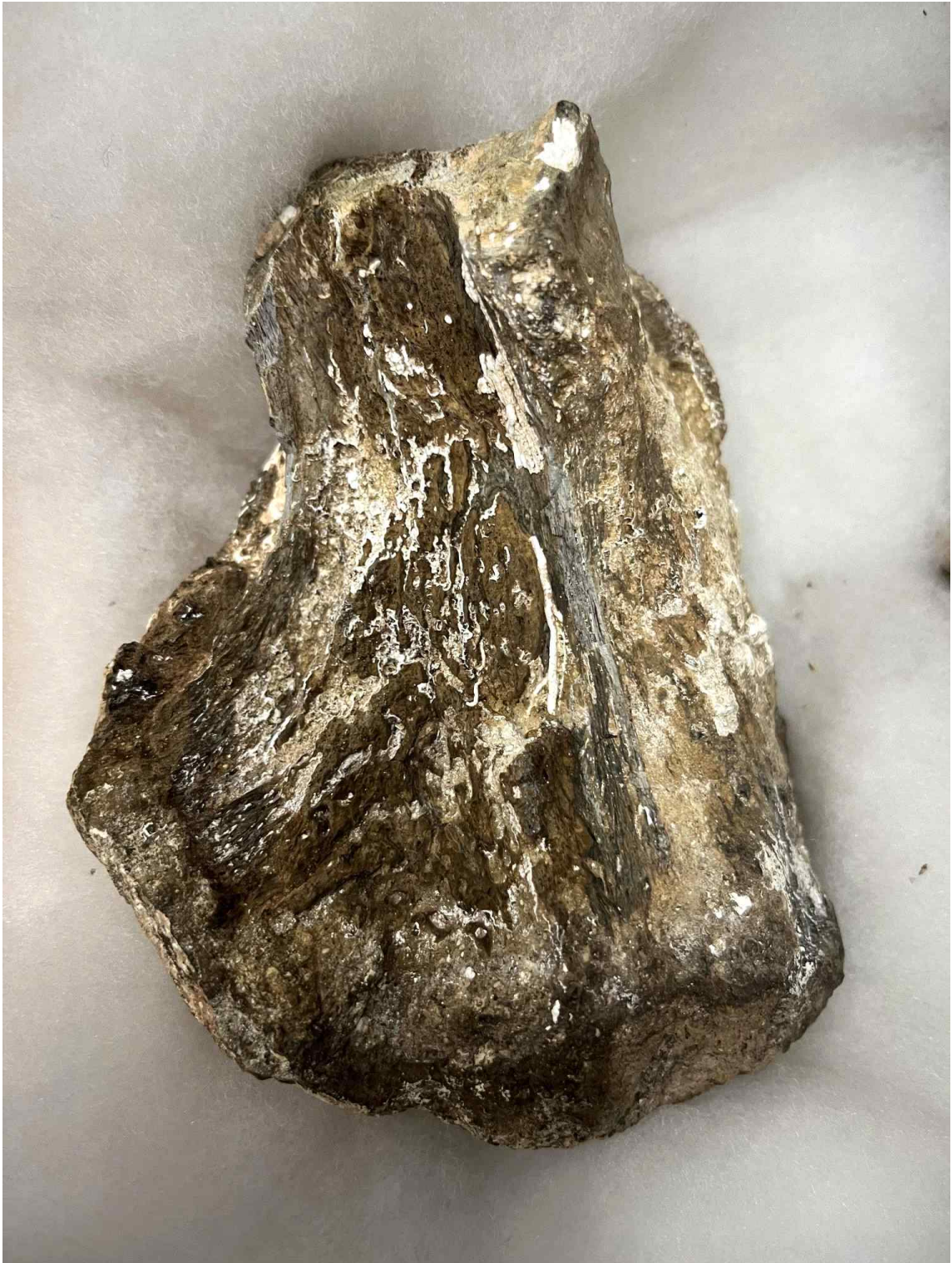
< 육식공룡의 이빨 자국이 남아 있는 대형 초식공룡의 화석 >