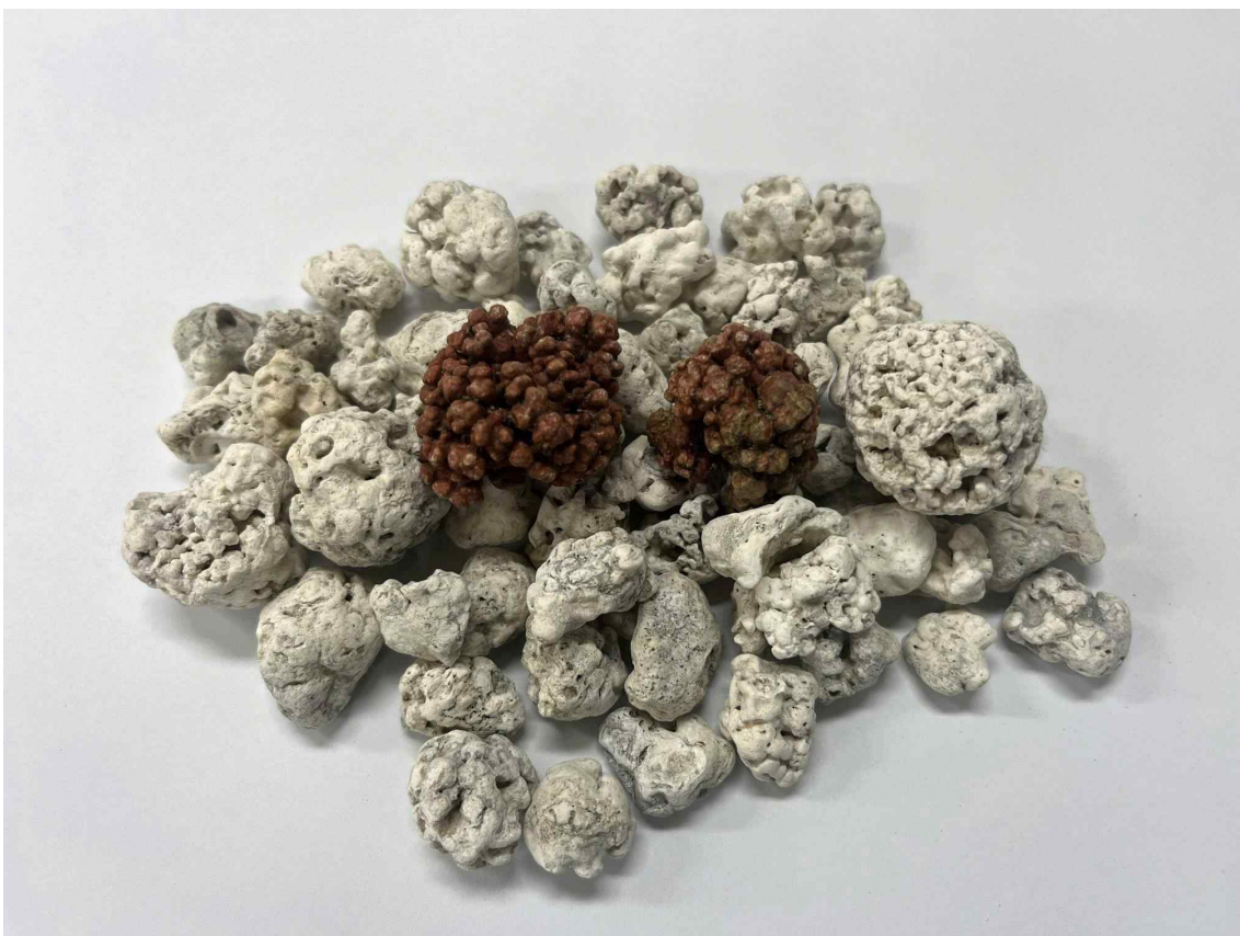
< 우도의 홍조단괴(붉은색이 사라진 홍조단괴와 붉은색을 나타내는 홍조단괴) >