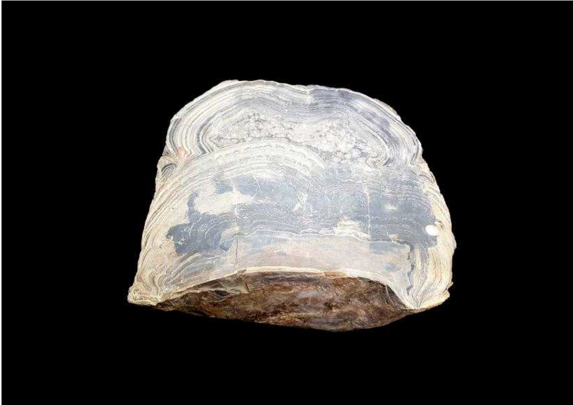
< 스트로마톨라이트 암석 >