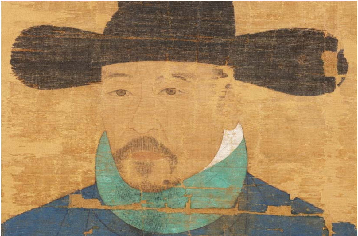
<얼굴: 갈색으로 윤곽선을 표현하고 내부를 엷은 황토색으로 채움>